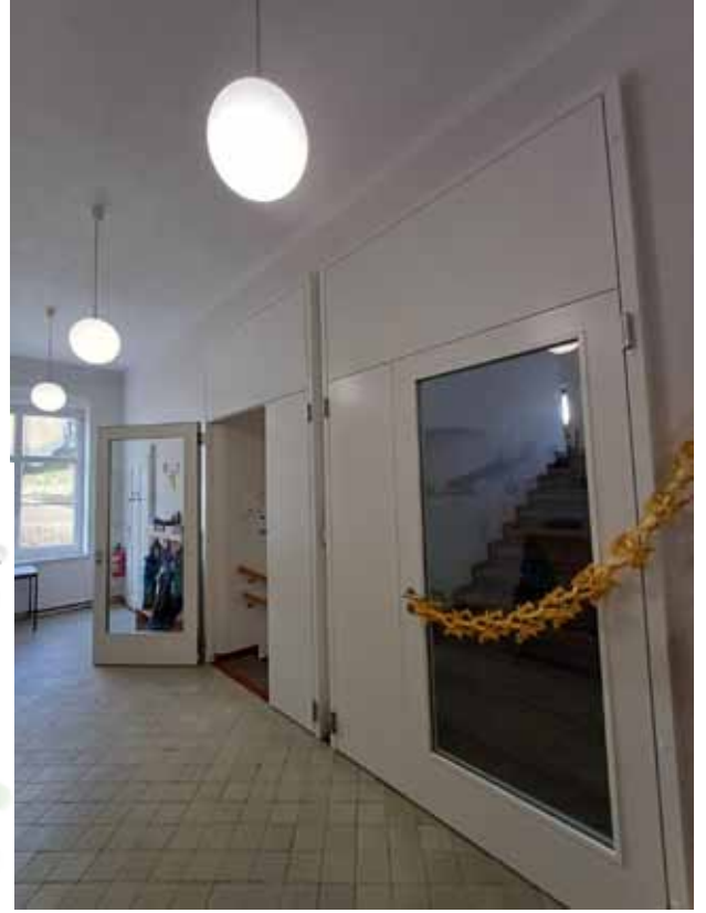
Die neuen Türen in der 4. Kindergartengruppe